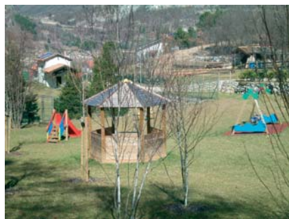
Tre immagini del nuovo parco

Da tempo l'Amministrazione era consapevole che i paesi di Porte e Dosso necessitavano di uno spazio "importante" di tipo sportivo, ricreativo e di aggregazione; la mancanza di un'adeguata area a verde pubblico attrezzato associata all'andamento demografico in costante crescita, con la presenza di nuclei fami-